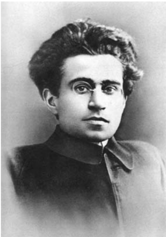
Antonio Gramsci, um 1920 (gemeinfrei)

Die ausgebeuteten Bäuerinnen und Bauern im Süden des Landes waren alles andere als klassenbewusst. Ihr kollektives Bewusstsein von sich selbst war, wie ihre Geschichte insgesamt, »notwendigerweise bruchstückhaft und episodisch«, wie Gramsci in den »Gefängnisheften« schrieb. Weil sie sich in dieser Hinsicht vom Industrieproletariat unterschieden, benutzte Gramsci auch einen anderen Begriff, um sie zu beschreiben: Er nannte sie »Subalterne«. Wie in der Einleitung zum vorliegenden Band klar herausgearbeitet wird, sind die Subalternen bei Gramsci aber nicht nur eine soziologische Kategorie, der Begriff charakterisiert auch ein politisches Unterdrückungsverhältnis ebenso wie eine »kulturelle Verfasstheit«.