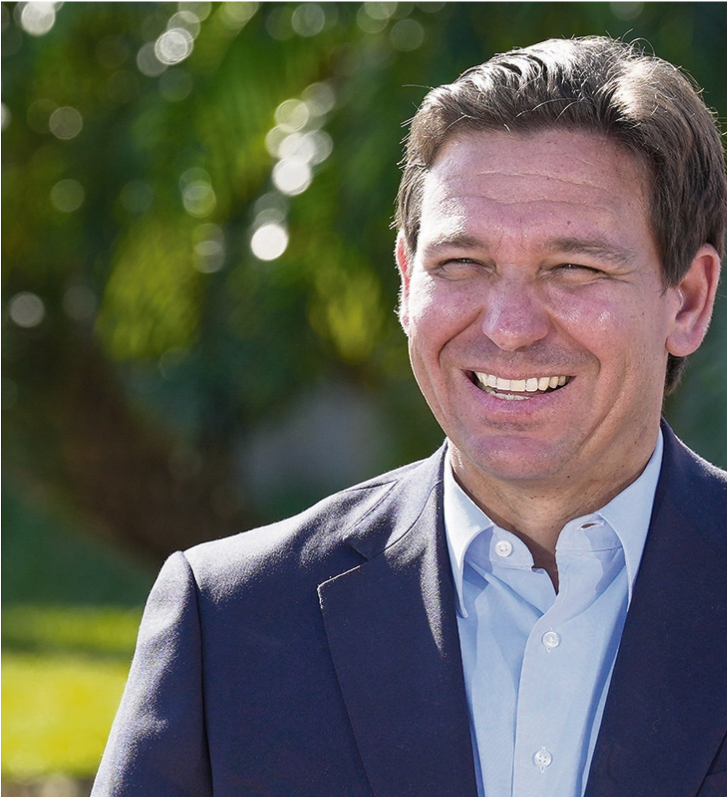
Ron DeSantis: Der Schaumschläger

Aber das Feindbild stimmt. DeSantis fehlt das Charisma des authentischen Schreihalses – warum die B-Version wählen, solange das Original noch im Rennen ist? Doch er belegt derzeit in Umfragen mit etwa zwölf Prozent den zweiten Platz und wäre der wahrscheinlichste Ersatz beim Ausscheiden Trumps. Im Fall eines Wahlsiegs würde er sich wohl weiter dem Kulturkampf widmen und ansonsten den Vorgaben des Project 2025 folgen.